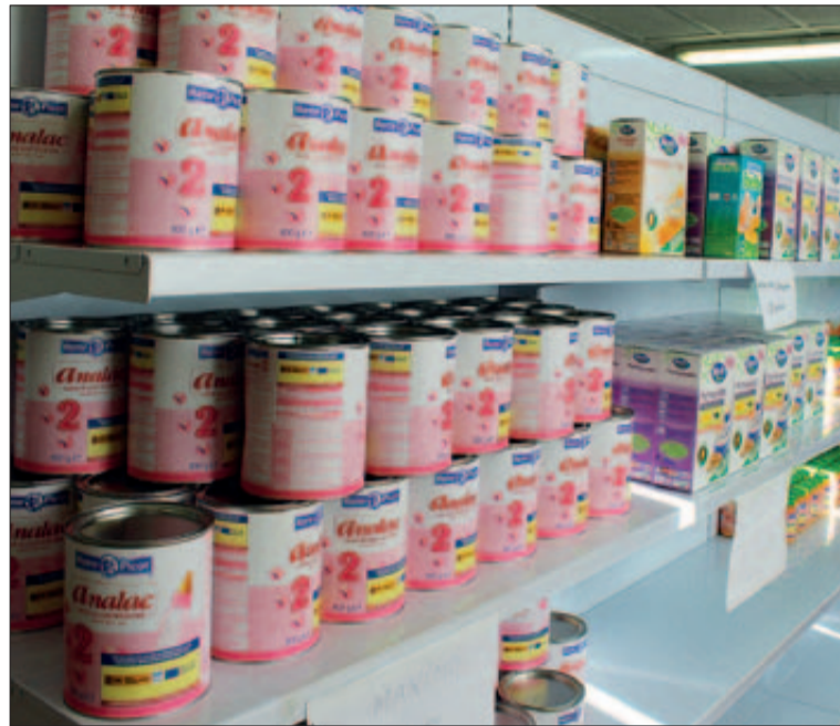
L'Olivera, la botiga social de Badia del Vallès, és un dels projectes sorgits de la suma dels esforços de l'Ajuntament, entitats socials i persones voluntàries.

Des de l'Ajuntament de Badia del Vallès es vol agrair i reconèixer la tasca de totes aquelles persones que inverteixen part del seu temps lliure a donar un cop de mà per desenvolupar aquests i altres projectes, i ajudar aquelles persones que més ho necessiten. ■