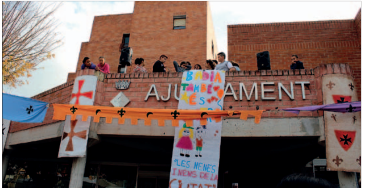
Després de llegir el manifest commemoratiu de la Diada dels Drets dels Infants, un grup de nens i nenes va desplegar una pancarta on es llegia: Badia també és nostra.

El Consell es reunirà un cop al mes, al Casal dels Infants i tindrà funcions consultives tot i que, com s'ha dit, també tindrà