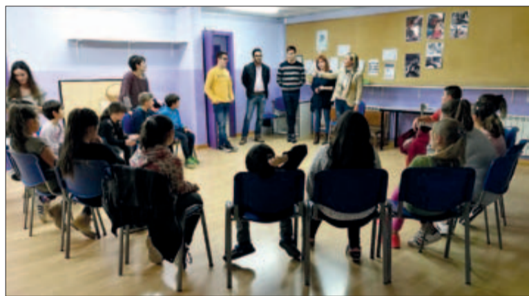
El Consell dels Infants en la seva primera sessió de treball

Els 15 membres que formen el Consell dels Infants, d'edats