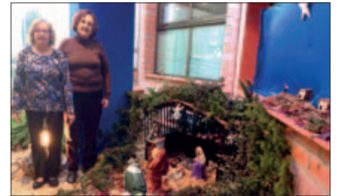
Com cada any, l'Associació de Vidus i Vidues ha muntat el pessebre que llueix a l'Ajuntament

Així mateix, durant tot el diumenge, l'av. de Burgos estarà ocupada amb les parades de la VI Fira de Nadal, que enguany tindrà com a temàtica Disney. A partir de les 10.30 h i fins les 21 h, a l'artèria principal de Badia, es succeiran desfilades, visites de personatges màgics, sortejos, tallers infantils, música i molt més. A causa de la celebració de la fira, organitzada per l'Associació de Comerciants, el tram central de l'av. de Burgos (entre els números 28 i 42) romandrà tallat al trànsit entre les 7 h del matí i la mitjanit de diumenge. Per aquest motiu, la parada d'autobús que hi ha a l'alçada de l'Ajuntament quedarà suprimida durant aquest espai de temps, tot i que serà la única, així que la ciutadania podrà utilitzar qualsevol de les altres parades existents.