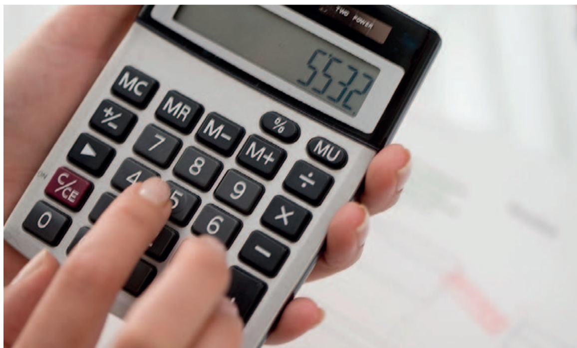
El servei dona informació sobre, entre d'altres, el càlcul de les quantitats a percebre, en cas de tenir-ne dret.

En relació amb aquest tema, us recordem que podeu consultar el recull que hi ha penjat al nostre web amb informacions pràctiques arran del Reial Decret-lei 1/2017, de mesures urgents de protecció de consumidors en matèria de clàusules terra (Portada > Consum > Informació sobre clàusules terra). ■