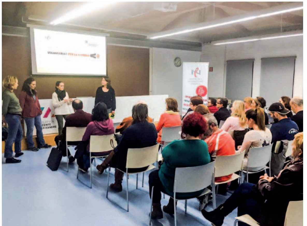
Imatge d'arxiu d'un acte del Voluntariat per la Llengua

També poden participar-hi els comerços i parades del Mercat Municipal. Aquests establiments s'ofereixen a atendre també en català a les parelles lingüístiques, perquè puguin practicar la conversa en un context real. Les entitats de la població també poden adherir-s'hi