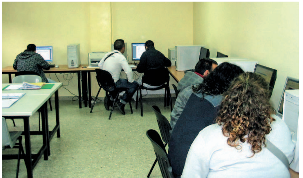
Al SMO es poden consultar ofertes de feina o realitzar cursos de formació.