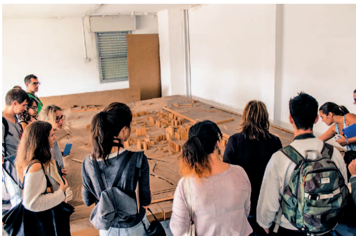
L'alumnat participant va fer una visita de camp a la zona d'estudi

La presentació havia de continuar amb una visita de camp, que finalment va tenir lloc dos dies més tard a causa de la pluja, a la zona d'estudi: els