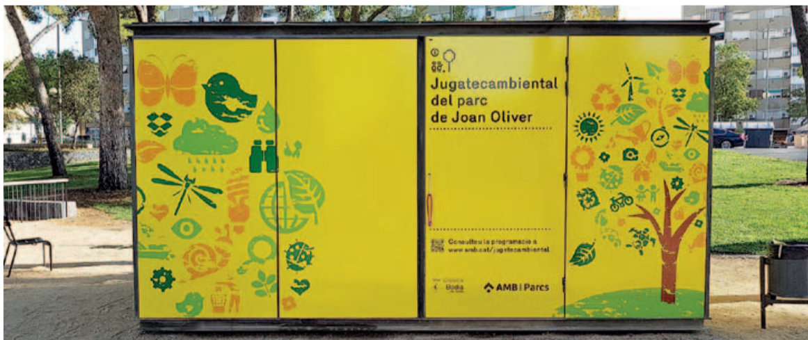
L'antic mòdul de la Jugatecambiental instal·lat al parc de Joan Oliver ha estat substituït per un de més gran.

Amb l'arribada de la tardor, arriba també una nova edició de la Jugatecambiental a Badia del Vallès. Des del passat 17 de setembre i fins el 26 de novembre, cada diumenge hi haurà una nova oportunitat de gaudir de les activitats relacionades amb la natura i el medi ambient i els tallers, espais de joc i experimentació,