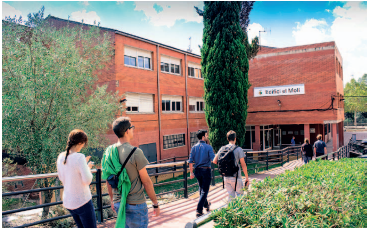
L'edifici El Molí acull el Servei Municipal d'Ocupació

A banda de totes aquestes opcions, l'SMO vol continuar oferint altres accions formatives que puguin resultar interessants a la ciutadania, adaptant-se a les seves demandes i a les característiques emergents del mercat laboral, per la qual cosa resta oberta a noves propostes. Així doncs, si hi esteu interessats/ades, no dubteu a apropar-vos al Servei Municipal d'Ocupació (edifici El Molí) per comentar-les o informar-vos-en. ■