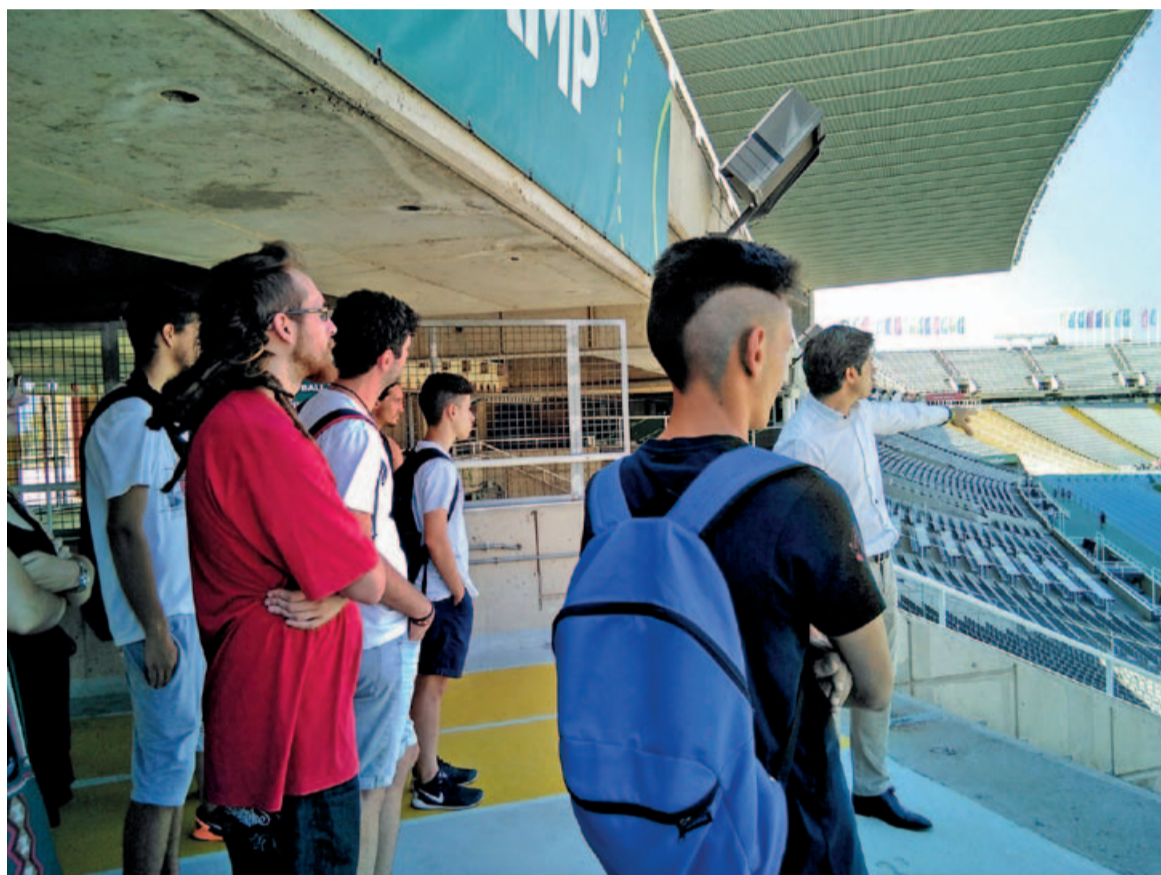
Alguns/es joves participants van fer una visita a l'Open Camp Barcelona

Mitjançant el programa, el jovent participant també té l'oportunitat de realitzar activitats fora del municipi, amb l'objectiu de donar-los a conèixer el món laboral del qual formaran part en un futur. En aquest marc es troben les visites d'entorn productiu, que es fan gràcies al conveni entre algunes empreses col·laboradores i les entitats que duen a terme el programa. En aquest sentit, alguns dels joves participants van realitzar, el passat mes de juliol, una visita al centre AKI Bricolaje de Terrassa i a l'Open Camp de Barcelona. Van poder tenir contacte directe amb els directius i els treballadors d'ambdues empreses, que els