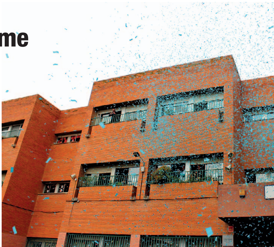
Una pluja de confeti va pintar el cel de color blau, símbol de l'autisme

La nostra ciutat se sumava així a la campanya internacional Light It Up Blue , endegada per l'organització Autism Speaks, que fa que molts edificis i espais públics d'arreu del món es teneixin de blau cada 2 d'abril. ■