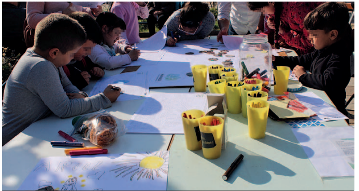
Durant la presentació, els més petits també van tenir el seu taller

El Pla d'acció de Badia del Vallès és el document que identificarà les situacions que s'han de millorar de manera prioritària, l'estratègia a seguir, els actors que s'hi hauran d'involucrar i les accions concretes que s'hauran d'implementar amb l'horitzó 2020. La redacció del Pla d'acció local està impulsada pel Grup Central de Debat, un grup de veïns i veïnes i persones vinculades amb entitats, associacions i institucions públiques interessades a contribuir a la millora de la ciutat. L'Ajuntament de Badia del Vallès i l'Àrea Metropolitana de Barcelona en són membres actius.