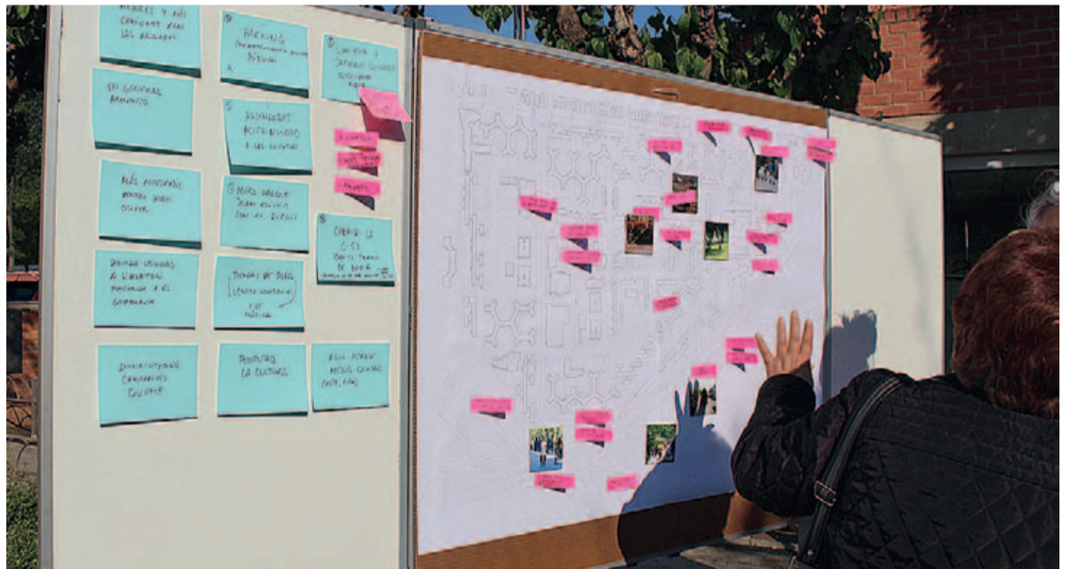
La ciutadania va poder participar en el taller Construeix la Badia dels teus somnis