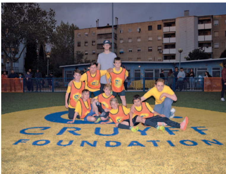
La Segui al Poder, equip campió en categoria masculina

part en la competició, tant en categoria masculina com en femenina.