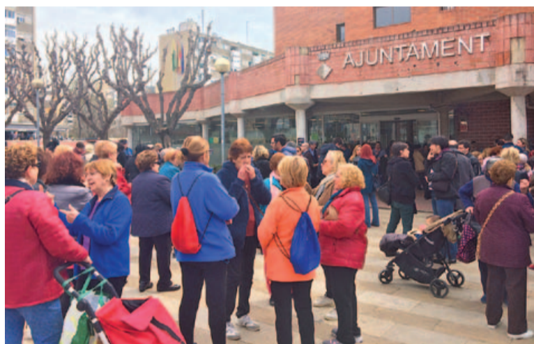
Aturada reivindicativa al davant de l'Ajuntament

de l'Ajuntament, als quals es van sumar moltes ciutadanes i ciutadans, així com càrrecs polítics, van respondre a la crida feta des de la Regidoria d'Igualtat del consistori i van aturar la seva activitat durant uns minuts, durant els quals van sortir a les portes de l'edifici per fer visible la seva reivindicació. L'Ajuntament de Badia del Vallès se sumava d'aquesta manera