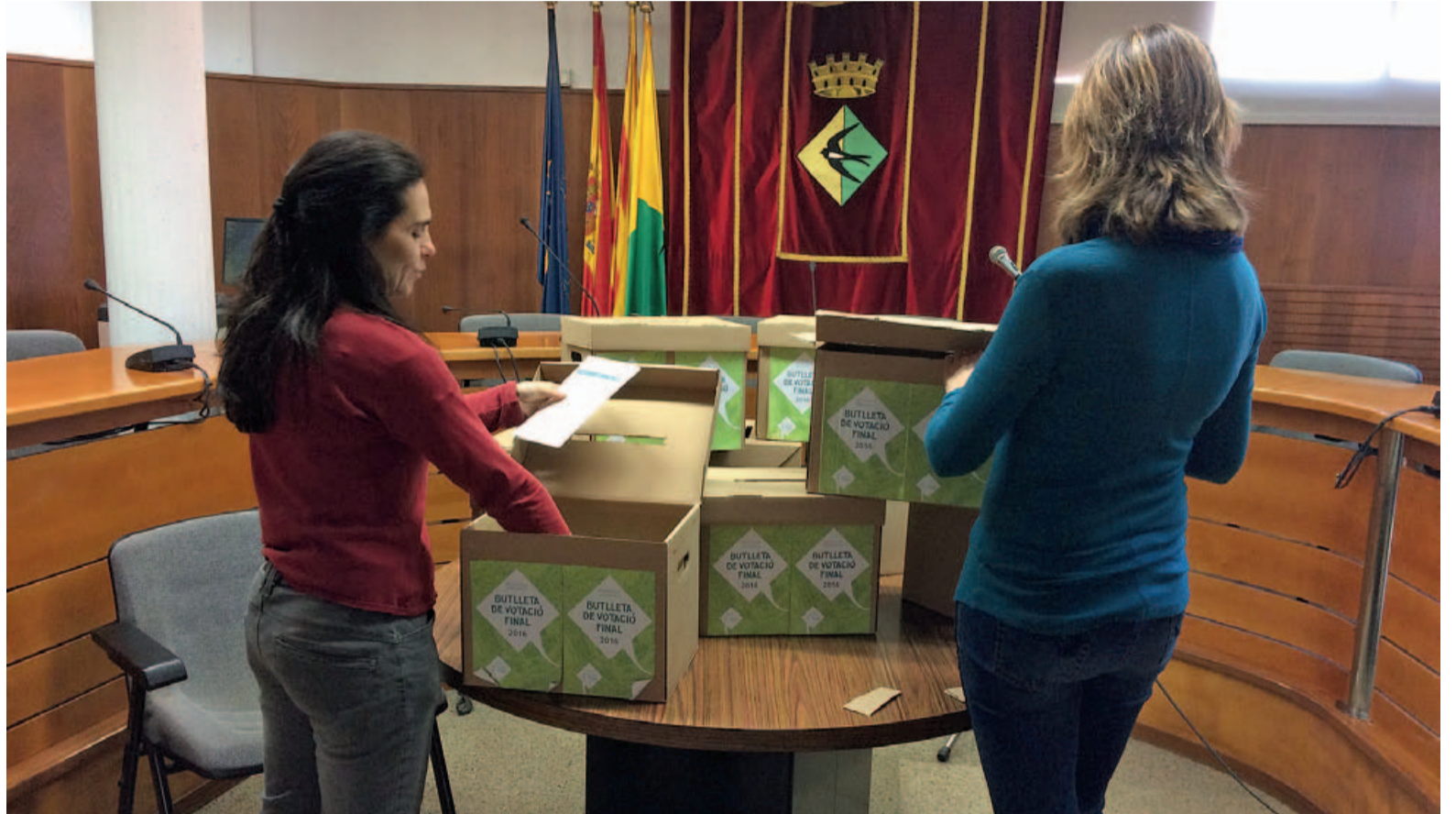
Moment de l'obertura de les urnes per iniciar el recompte de vots

A banda d'aquestes dues propostes escollides, la ciutadania en va poder votar sis més. El tercer projecte amb més nombre de vots, va ser la del Passeig de Badia (20.000 euros aprox.), que consistia a condicionar el camí que va des de darrere de la Deixalleria fins a l'av. de la Via de la Plata i que va acumular un total de 135 vots. La següent proposta classificada, la