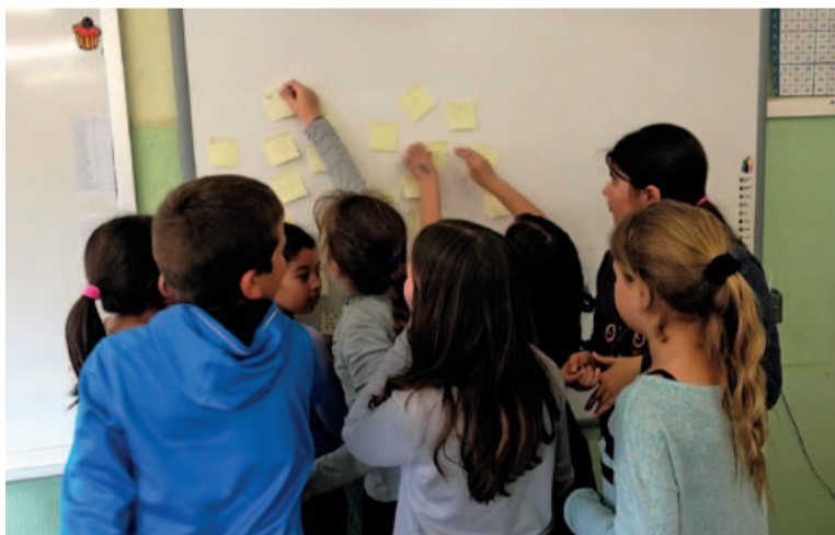
L'alumnat de 5è i 6è de les escoles de la ciutat va prendre part en un procés participatiu per a proposar activitats infantils per a la Festa Major