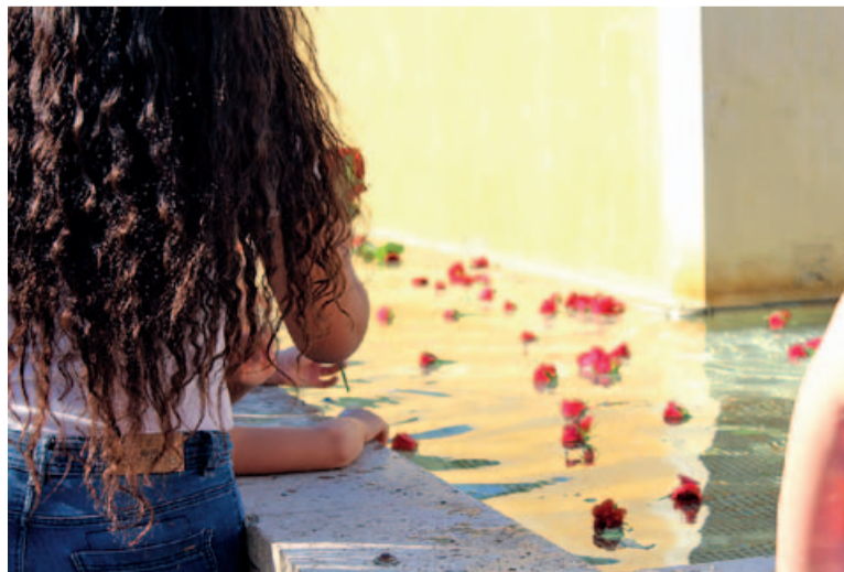
Roses vermelles a la font de la plaça en homenatge a les víctimes gitanes de l'Holocaust nazi

Entre les activitats de la tarda, que van involucrar petits i grans, hi va haver jocs, tallers i una xocolatada. Fins i tot, i malgrat el sol que lluia en aquell moment, hi va haver neu a la plaça Major. La festa va començar amb l'actuació de les components del grup de ball Las Chay's, que van arrencar molts aplaudiments. Aquesta vegada, també, els nois van tenir el seu