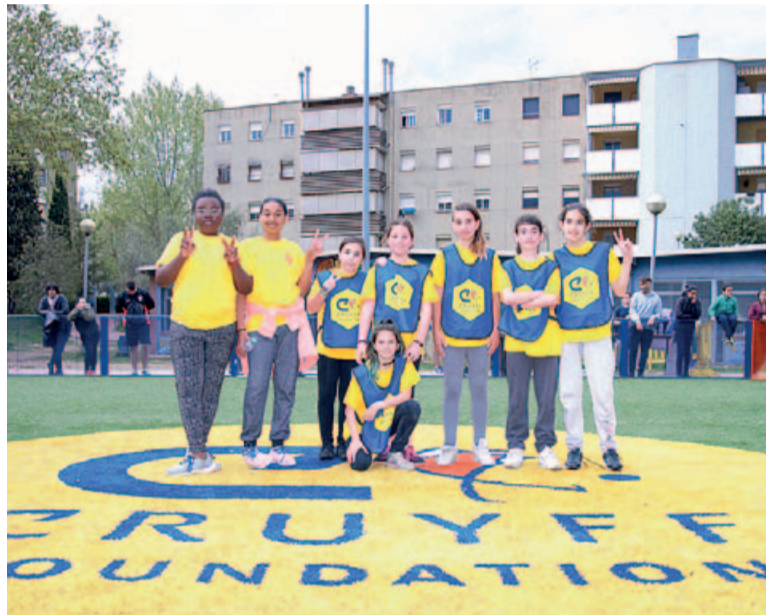
L'equip vencedor en categoria femenina, Football Team Seguidillas

El torneig va tenir lloc el passat 5 d'abril, i s'emmarca en el programa Community, promogut per la Fundació Johan Cruyff. Nombrós públic es va donar cita a la Cruyff Court Sergio Busquets per animar els diferents equips que van prendre