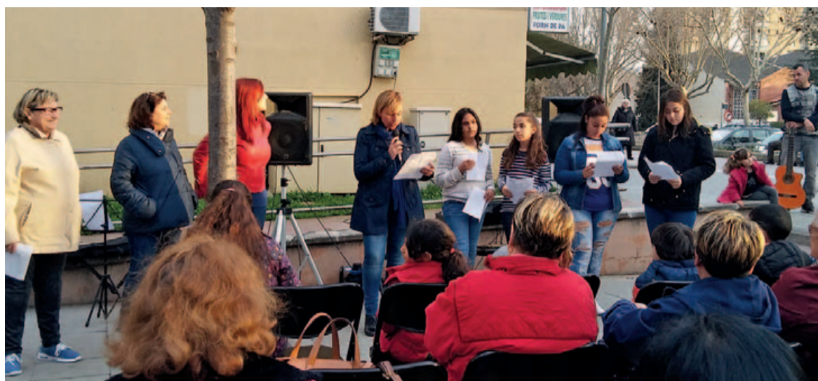
Acte commemoratiu a la plaça de la Dona

a l'aturada internacional que es va seguir a una cinquantena de països de tot el món, com a mostra de la unitat femenina contra les violències masclistes, per posar en valor la vital contribució de les dones a la societat i com a denúncia de la discriminació que encara pateixen les dones en tots els àmbits.