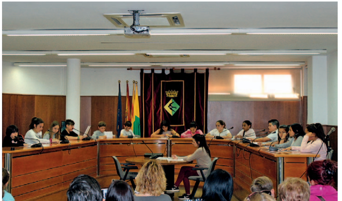
La primera sessió plenària del Consell dels Infants va tenir lloc a la Sala de Plens de l'Ajuntament

Tot seguit es va obrir un torn de paraules on el públic assistent va poder fer preguntes