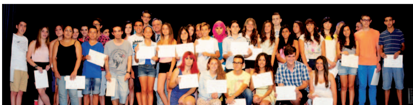
Guardonats als premis d'excel·lència. Curs 2013-2014

de batxillerat, relacionats amb les arts, les ciències de la naturalesa, de la salut i del medi ambient, les ciències socials, les humanitats, les llengües, l'educació física, les matemàtiques i la tecnologia.