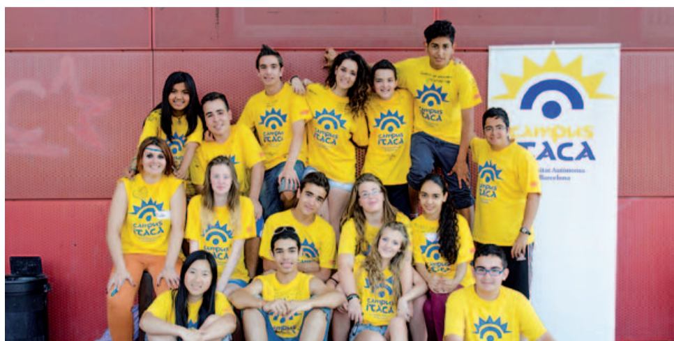
Participants de Badia al Campus Ítaca 2013

El programa Campus Ítaca (programa socioeducatiu per a l'alumnat de secundària) té l'objectiu d'animar els alumnes a continuar estudiant després d'acabar l'etapa d'ensenyament secundari obligatori. El perfil d'alumnat al qual va adreçat és el d'estudiants amb bons resultats acadèmics que per diferents motius no es senten atrets per l'opció de continuar estudiant.