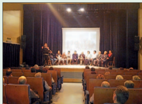
Trobada a l'Auditori Municipal amb les entitats i associacions del municipi

Durant aquests mesos, a banda de les reunions a les comunitats, també es van organitzar altres trobades a d'altres indrets, com al Casal de Joves, per al més joves de la ciutat; al Casal d'avis, per explicar tot el procés a la gent gran o la que es va fer per a entitats i associacions a l'Auditori Municipal. En aquest sentit, la Biblioteca Vicente Aleixandre, també va acollir diverses reunions d'aquest caire, per informar a totes les persones que no havien pogut assistir en el seu moment, a la comunitat que els pertocava. Fins i tot, es va organitzar una trobada per explicar el funcionament del pressupost municipal de l'Ajuntament.