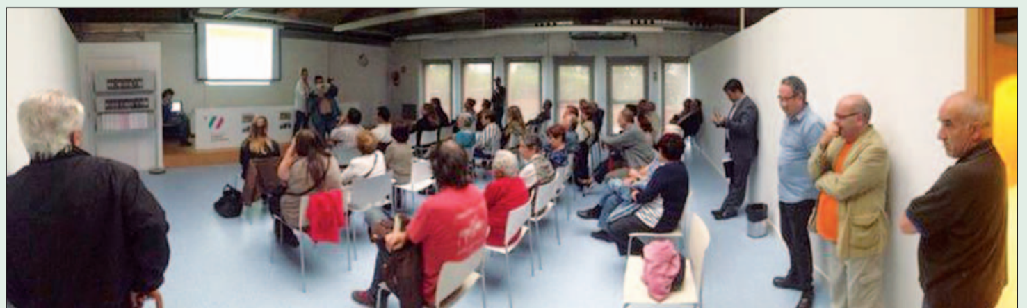
Sessió informativa sobre el pressupost municipal a la Biblioteca Vicente Aleixandre

Les reunions van ser molt participatives. Cadascú podia dir la seva opinió. De fet, es van recollir diverses propostes i suggeriments. Al llarg de tots aquests mesos, s'han anat recollint signatures d'adhesió al document de proposta de modificació de la Llei, que hores d'ara es presentarà al Parlament de Catalunya per aconseguir un finançament just i suficient per a la ciutat, que estigui garantit per llei.