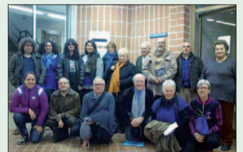
Membres del Grup Motor

En aquest procés es va comptar amb un grup de ciutadans i ciutadanes (grup motor), escollits per diferents rangs d'edat, que van ser la guia principal del procés participatiu i van col·laborar en tot el material que s'ha editat.