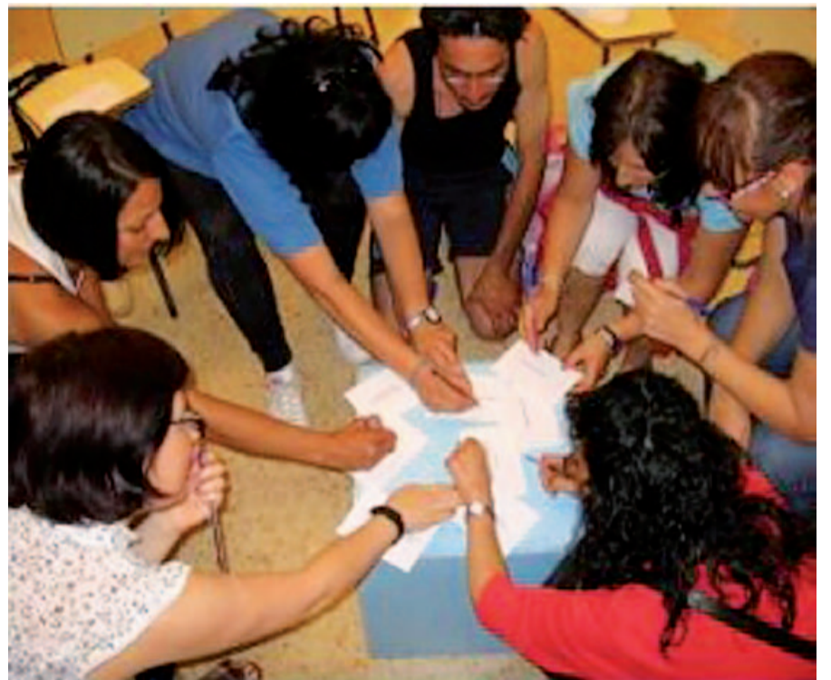
Un grup de pares en una sessió de l'ASEF

Finalment, i a través del Consell Municipal d'Educació, es vol potenciar la co-responsabilitat educativa en la comunitat.