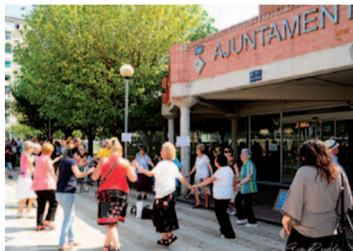
Ballada de sardanes a la plaça Major

Posteriorment, la plaça Major va acollir la tradicional ballada de sardanes, que cada any organitza Badia Sardanista i un petit refrigeri a tots els assistents. La novetat d'enguany és que es podia participar d'uns tallers durant tot el matí, que consistien en pintar baldufes i elaborar imants amb la senyera catalana.