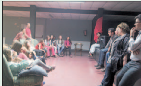
Trobada amb el jovent, al Casal de Joves

Les reunions van ser molt participatives. Cadascú podia dir la seva opinió. De fet, es van recollir diverses propostes i suggeriments. Al llarg de tots aquests mesos, s'han anat recollint signatures d'adhesió al document de proposta de modificació de la Llei, que hores d'ara es presentarà al Parlament de Catalunya per aconseguir un finançament just i suficient per a la ciutat, que estigui garantit per llei.