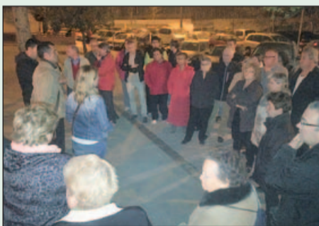
Reunió a l'avinguda de la Mediterrània

Durant aquests mesos, a banda de les reunions a les comunitats, també es van organitzar altres trobades a d'altres indrets, com al Casal de Joves, per al més joves de la ciutat; al Casal d'avis, per explicar tot el procés a la gent gran o la que es va fer per a entitats i associacions a l'Auditori Municipal. En aquest sentit, la Biblioteca Vicente Aleixandre, també va acollir diverses reunions d'aquest caire, per informar a totes les persones que no havien pogut assistir en el seu moment, a la comunitat que els pertocava. Fins i tot, es va organitzar una trobada per explicar el funcionament del pressupost municipal de l'Ajuntament.