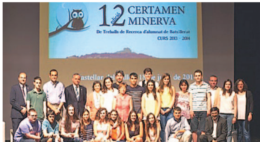
Guardonats en l'edició del Certamen Minerva de 2014

de batxillerat, relacionats amb les arts, les ciències de la naturalesa, de la salut i del medi ambient, les ciències socials, les humanitats, les llengües, l'educació física, les matemàtiques i la tecnologia.