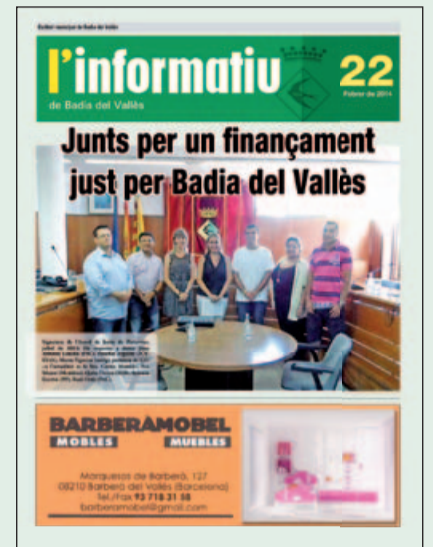
Especial de l'Informatiu