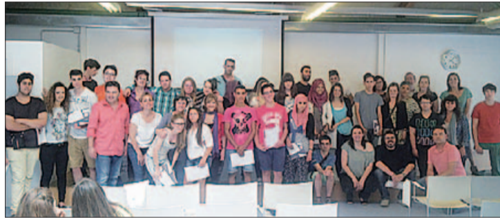
Participants al projecte Cruïlla el curs 2013-2014

termini. L'Ajuntament realitza aquest projecte als dos centres de secundària en el marc d'un conveni signat amb el Departament d'Ensenyament i amb la participació del teixit empresarial del municipi i dels municipis propers.