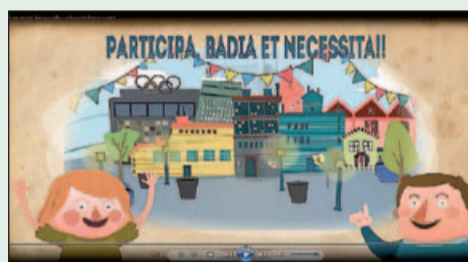
Vídeo explicatiu sobre la proposta de modificació de la Llei de creació de Badia del Vallès.

Per explicar tot el procés, es van editar diversos materials: des d'un vídeo explicatiu per difondre a través de les xarxes socials, cartes a tots els veïns i veïnes i també, un Informatiu específic.