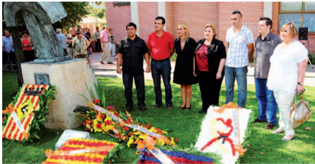
L'Alcaldesa i els Portaveus dels grups municipals del Consistori durant la celebració de la Diada Nacional de Catalunya

Un any més, el monòlit de l'oreneta de l'Ajuntament va ser el punt de trobada, per commemorar la Diada Nacional de Catalunya a Badia del Vallès. L'acte va comptar amb una gran participació per part de les associacions i entitats badienques i l'expectació de molts ciutadans i ciutadanes.