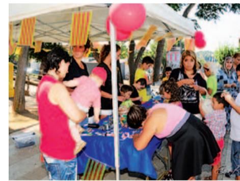
Taller de pintar senyeres