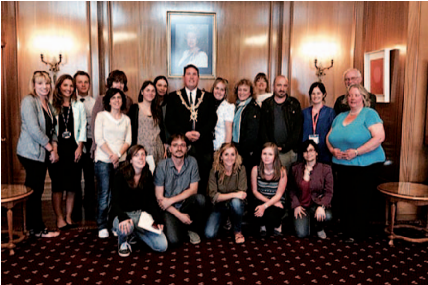
Tècniques i professorat durant la trobada de treball el juliol de 2014 a Portsmouth

Els socis del projecte són l'ajuntament de la localitat anglesa de Portsmouth i les organitzacions: Motiv 8, Harbour School i Bivol Trust, de la mateixa localitat. Al Vallès Occidental s'hi ha implicat el Consorci per l'Ocupació i la Promoció Econòmica del Vallès Occidental (COPEVO) i els instituts Badia del Vallès i Federica Montseny, de Badia del Vallès, i els instituts Banús i Jaume Mimó, de Cerdanyola del Vallès.