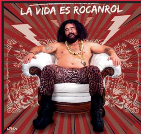
EL SEVILLA SÁBADO, 11 JUNIO · 23:59 H