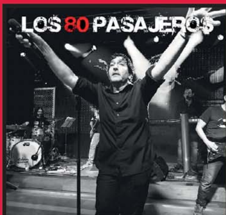
LOS 80 PASAJEROS SÁBADO, 5 MARZO · 23:30 H

APERTURA PARA CENAS: 21:00 H · DISCOTECA GRATIS