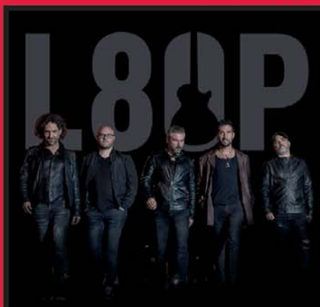
LOS 80 PRINCIPALES SÁBADO, 26 MARZO · 23:30 H