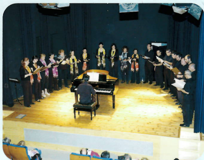
Concert de Festa major a càrrec de la coral Ginesta