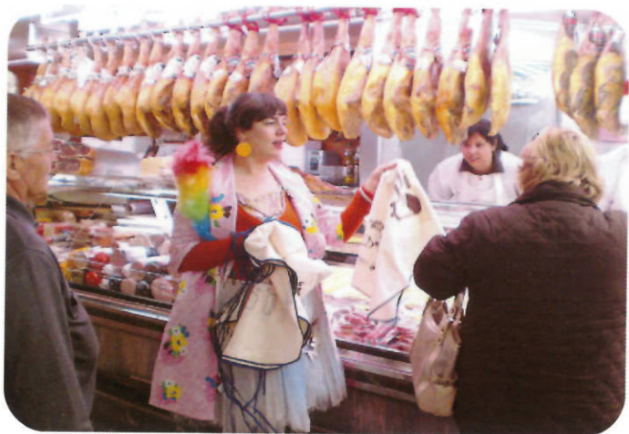
La "Recicleta" repartiendo delantales a los usuarios del mercado municipal

La inauguración de este nuevo equipamiento se aprovechó para concienciar a todos los usuarios del mercado de la necesidad de desechar selectivamente los residuos. Para hacerlo, la "Recicleta" visitó todas las paradas regalando a los usuarios del mercado un delantal con la frase "La materia orgánica del cubo al jardín" y hablando con los compradores/as y paradistas sobre el hábito de reciclar tanto en el mercado como en casa.