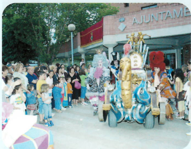
La companyia Barroco Roll va entretenir a grans i petits