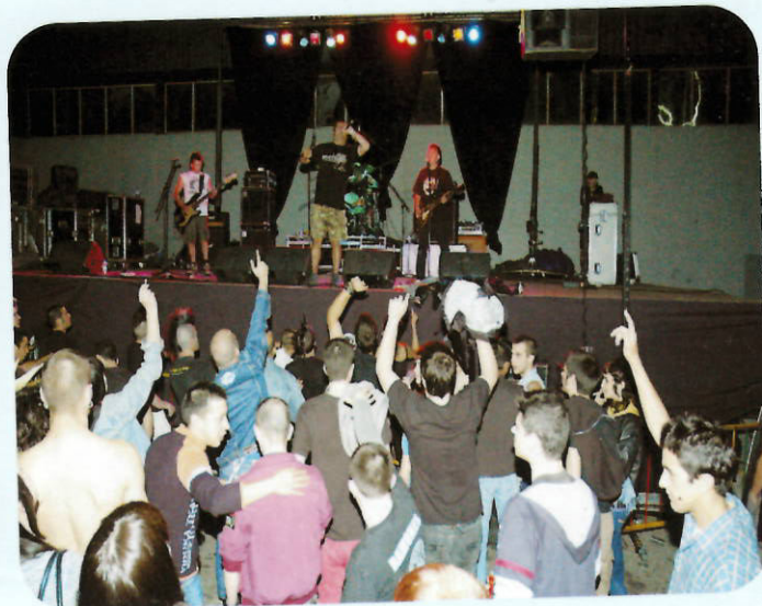
Els i les joves van gaudir una vegada més del Badia'n' Rock