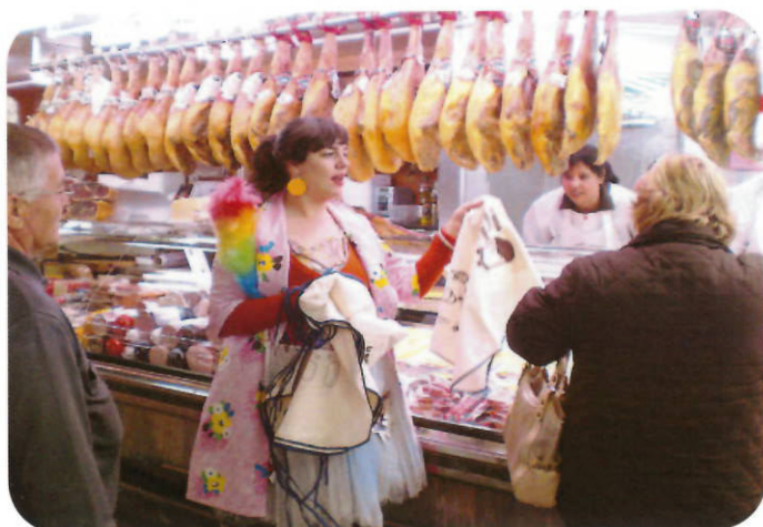
La "Recicleta" repartint davantals als usuaris del mercat municipal

La inauguració d'aquest nou equipament es va aprofitar per conscienciar a tots els usuaris del mercat de la necessitat d'abocar selectivament els residus. Per a fer-ho, la "Recicleta" va visitar totes les parades regalant als usuaris del mercat un davantal amb la frase "La matèria orgànica del cubell al jardí" i parlant amb els compradors/es i paradistes sobre l'hàbit de reciclar tant al mercat com a casa. Amb un altre tipus de davantals anaven abillats i abillades els i les paradistes del mercat, en aquesta ocasió la vestimenta donava la informació necessària per separar la matèria orgànica de la millor manera possible.