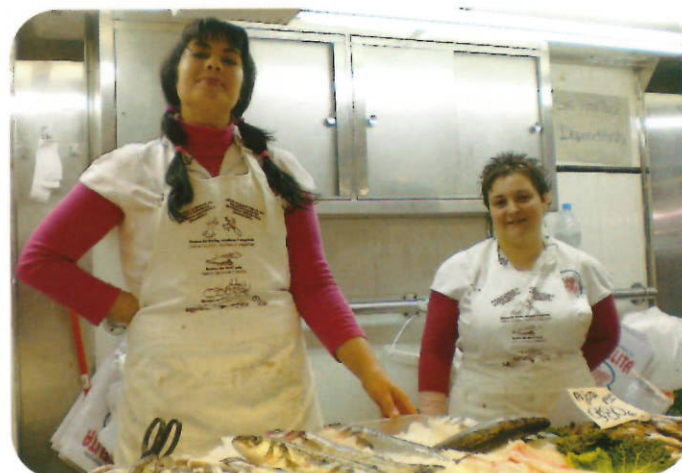
Paradistes lluint el davantal que promou un bon reciclatge

En la Minideixalleria municipal els particulars poden dipositar diferents tipologies de residus: consumibles informàtics, petits aparells, fluorescents i bombetes, radiografies, oli de cuina, piles, roba i calçat, envasos, pa dur, paper-cartró i vidre. Un cop els usuaris han dipositat selectivament els seus residus, setmanalment, personal de la brigada de neteja trasllada aquests residus a la deixalleria municipal, per després portar-los als gestors pertinents per a la seva reutilització, recuperació i reciclatge.