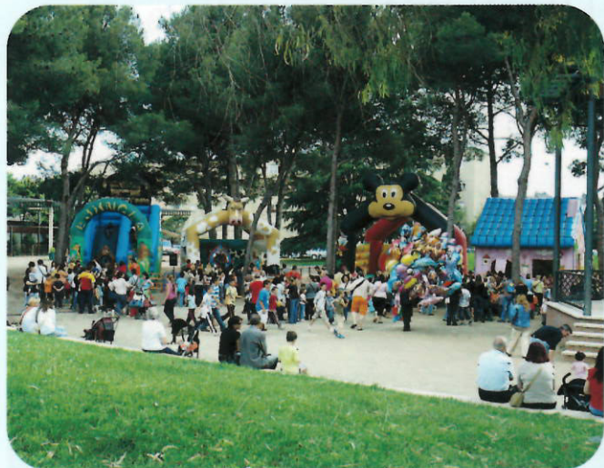
Els més menuts van gaudir tot el cap de setmana de la Fira Infantil