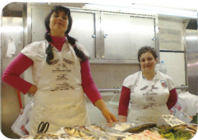
Paradistas luciendo el delantal que promueve un buen reciclaje

Con otro tipo de delantales iban ataviados y ataviadas los y las paradistas del mercado, en esta ocasión la vestimenta daba la información necesaria para separar la materia orgánica de la mejor manera posible.