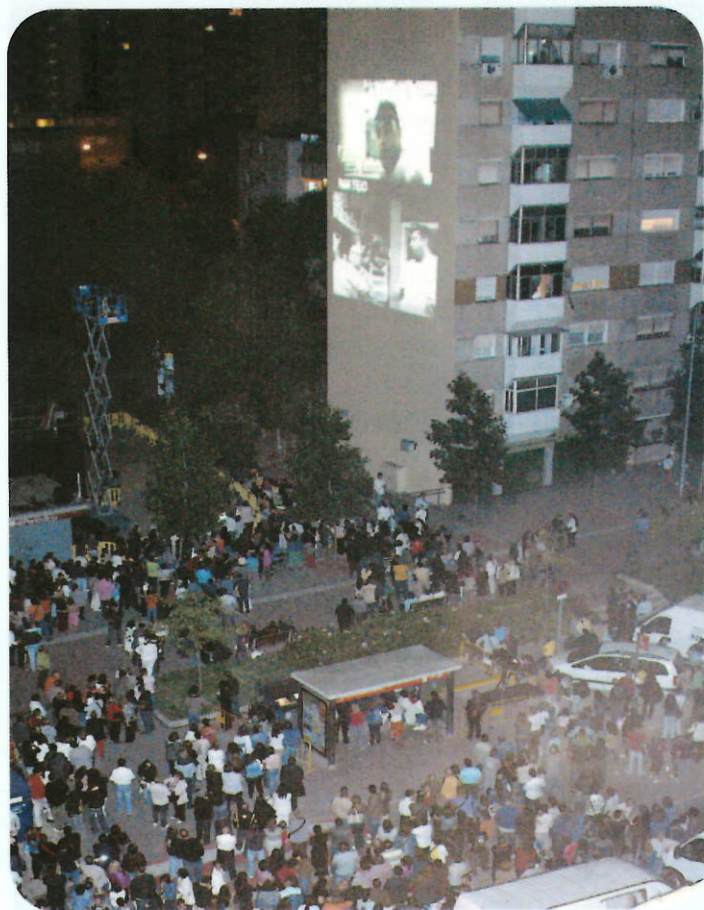
Visionat del documental "14.000 finestres"

Una de les majors expectatives de la Festa major d'enguany ha estat "PlasmA, òptiques culturals urbanes". Amb aquesta proposta cultural s'han assolit els objectius previstos al projecte: la implicació de la ciutadania en un projecte artístic i cultural que alhora que s'ha convertit en un referent per a Badia del Vallès.