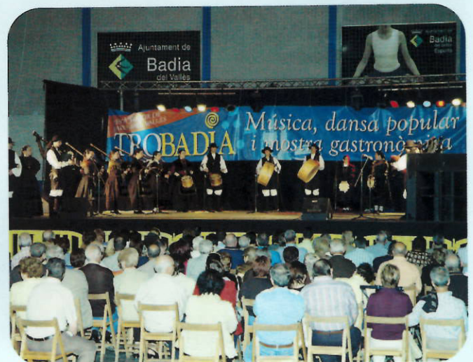
Un año más el Trobadia llenó las instalaciones deportivas