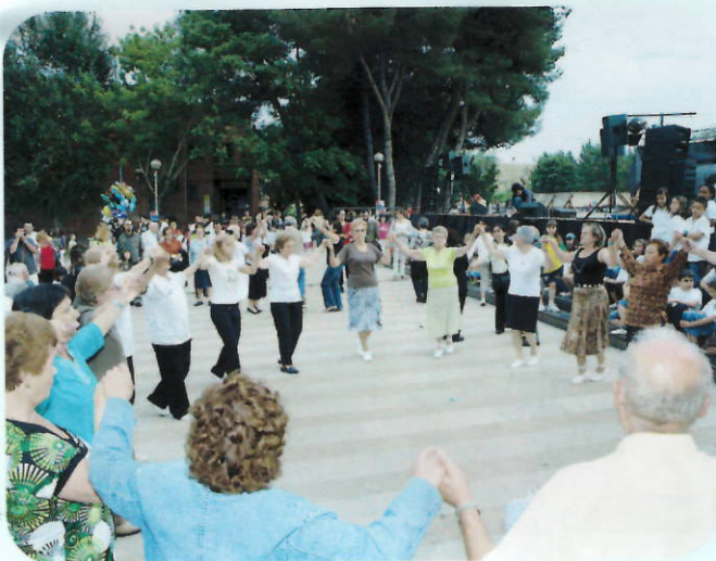
La cultura catalana se reflejó con las sardanas