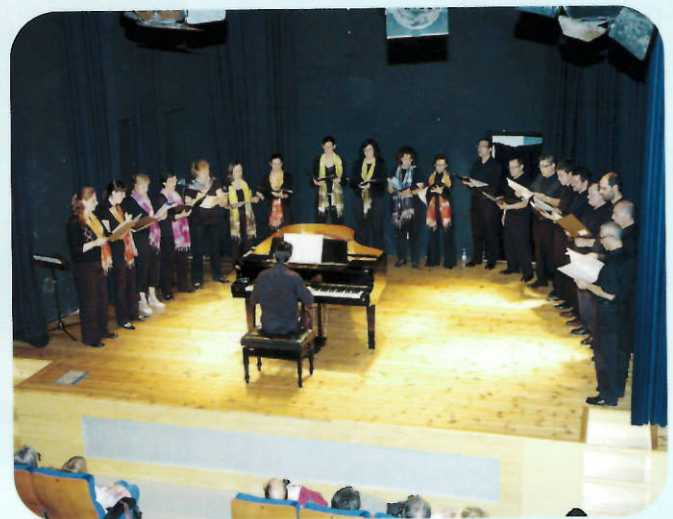
Concierto de Fiesta Mayor a cargo de la Coral Ginesta