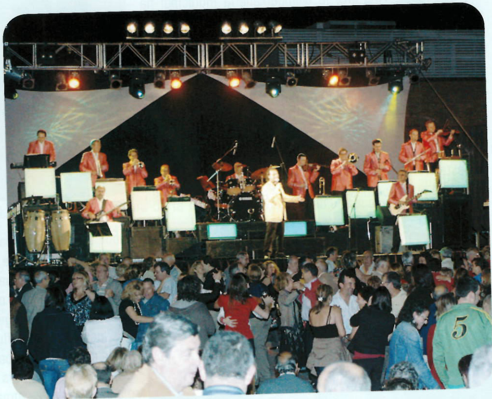
L'orquestra Maravella va fer ballar tots els badiencs i badienques

Durant tot el cap de setmana els badiencs i les badienques van poder gaudir d'un gran ventall d'actes, dirigits a totes les edats i a tot tipus de públic.