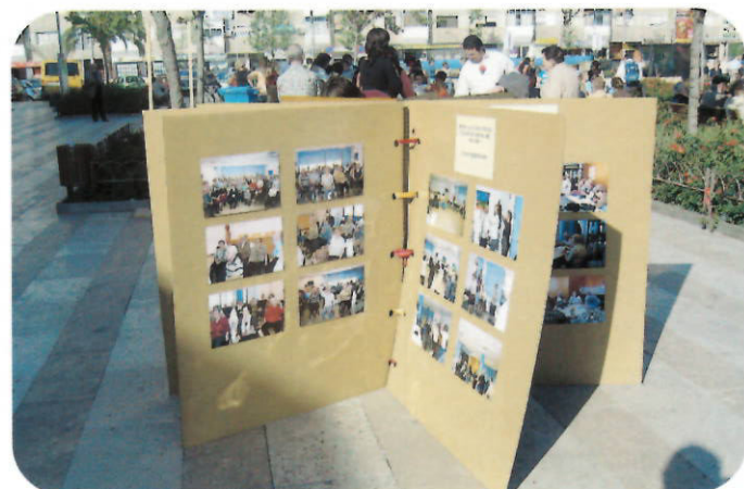
Libro gigante que muestra distintas actividades de las entidades badienses