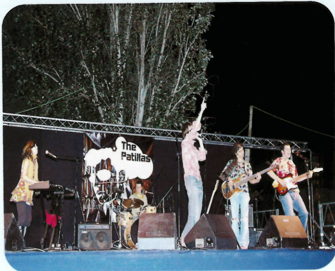
El grupo The Patillas amenizó la madrugada del sábado