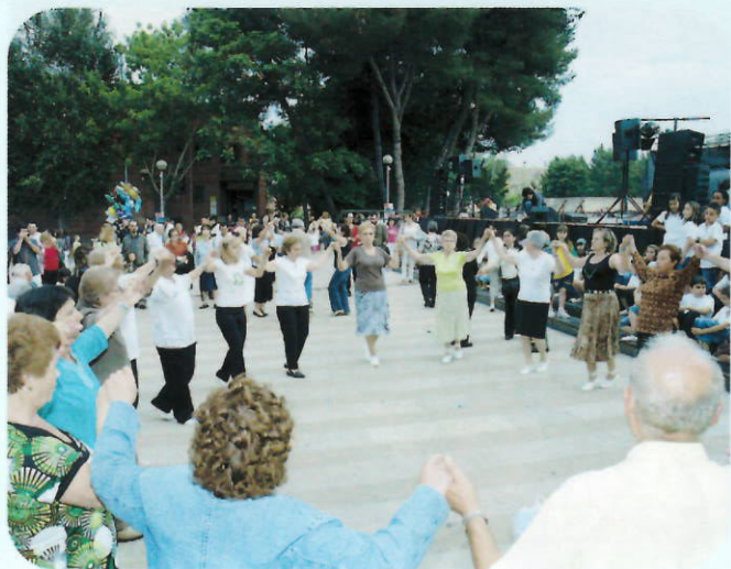
La cultura catalana es va reflectir amb la ballada de sardanes