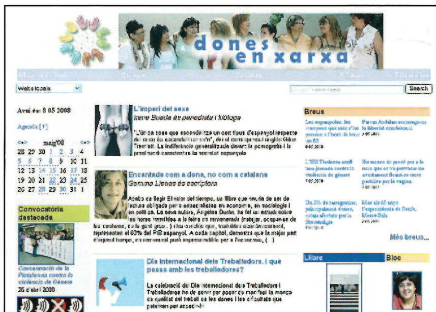
Vista de la plana web www.donesenxarxa.cat

cipen en altres moviments socials, i que Internet sigui per elles una eina de comunicació, ciutadania i visibilització. I fomentar la participació de les dones joves ja connectades en espais de dona dins de la xarxa.