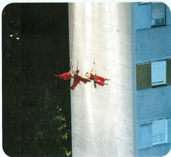
Deambulants va sorprendre als assistents amb les seves danses àrees

Per una altra banda BADIA 2.0, un taller fotogràfic impartit per membres del Club de Fotografia de Badia, va mostrar, a través de la manipulació digital, la transformació de diferents espais de Badia del Vallès per tal que els ciutadans del municipi poguessin crear imatges imaginades de la nostra, que reflecteixen les seves aspiracions, desigs i visions de futur. Amb totes aquestes iniciatives, "PlasmA, òptiques culturals urbanes", va aportar una nova visió de l'art a la Festa major i a la nostra ciutat.