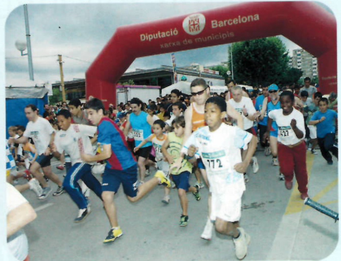
Éxito de participación en la 19na Carrera Popular