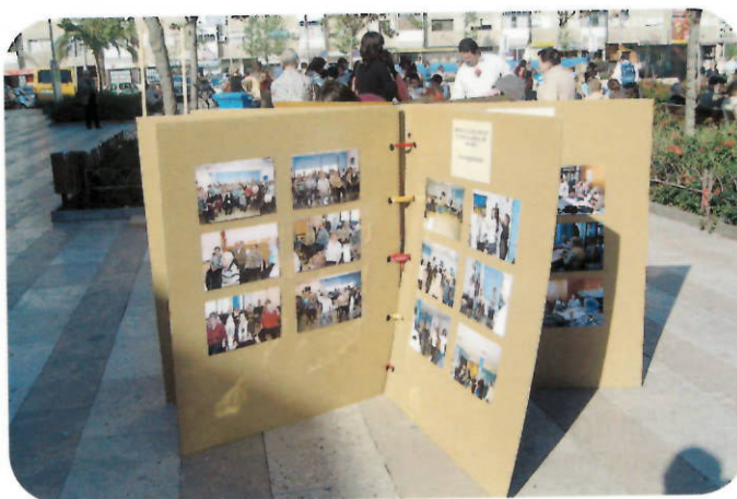
Llibre gegant que mostra diverses activitats de les entitats badienques