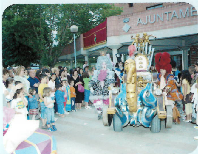
La compañía Barroco Roll entretuvo a grandes y pequeños