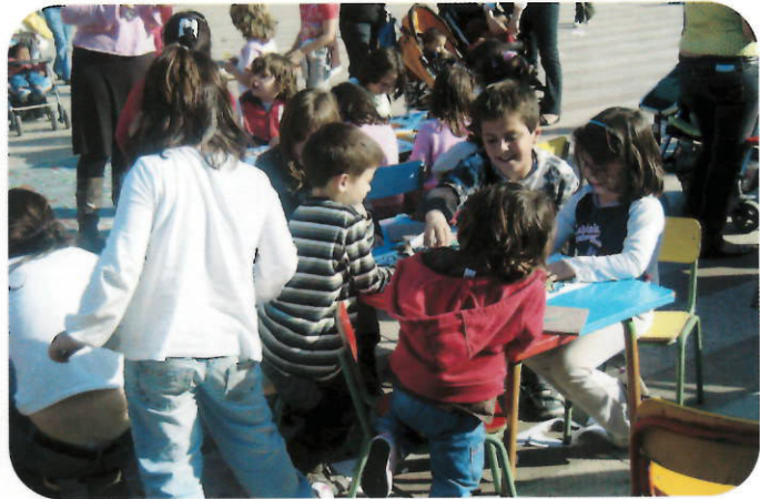
Actividades para los más pequeños

La fiesta también se aprovechó para hacer la entrega de premios de los diferentes certámenes literarios que se han realizado en Badía del Vallès. Así pues, el Auditorio Municipal acogió la entrega de galardones del Concurso Literario Escolar, del Concurso de Portada de Libro y del XI Certamen Poético de Badía del Vallès. Posteriormente además se realizó un recital poético en homenaje al poeta Miguel Hernández en el mismo Auditorio Municipal. Los actos de Sant Jordi finalizaron el día 30 con una actividad diseñada para la familia: "Marramiiii-aaaoooouu!!! narración con objetos" en la biblioteca Vicente Aleixandre.