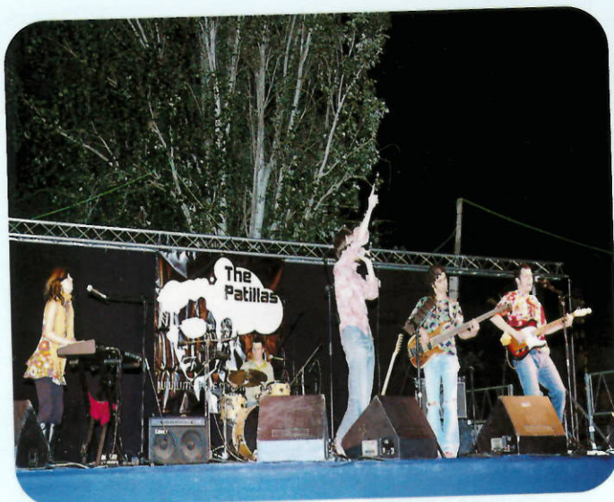
El grup The Patillas va amenitzar la matinada del dissabte