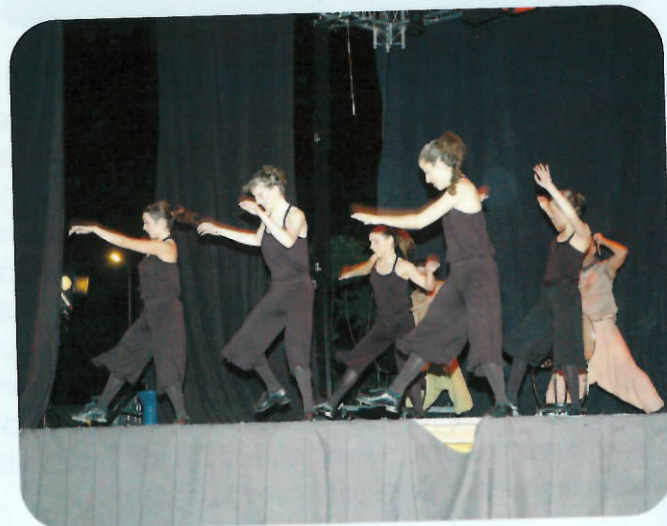
Un instant de l'espectacle Monkeys del grup Tateplas