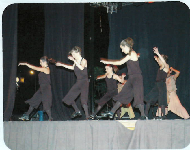
Un instante del espectáculo Monkeys del grupo Tateplas