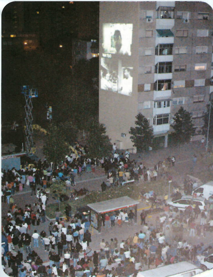
Visionado del documental "14.000 finestres"

Una de las mayores expectativas de la Fiesta Mayor de este año ha sido "PLASMA, ópticas culturales urbanas". Con esta propuesta cultural se han logrado los objetivos previstos en el proyecto: la implicación de la ciudadanía en un proyecto artístico y cultural que a la vez que se ha convertido en un referente en Badía del Vallès.