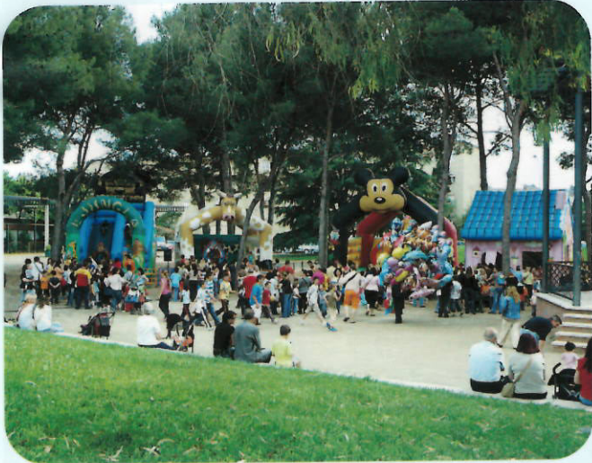
Los pequeños disfrutaron todo el fin de semana de la Feria Infantil