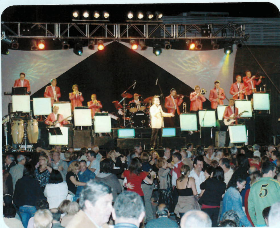
La orquesta Maravella hizo bailar a todos los y las badienses

Durante todo el fin de semana los y las badienses pudieron disfrutar de un gran abanico de actividades, dirigidas a todas las edades y a todo tipo de público.