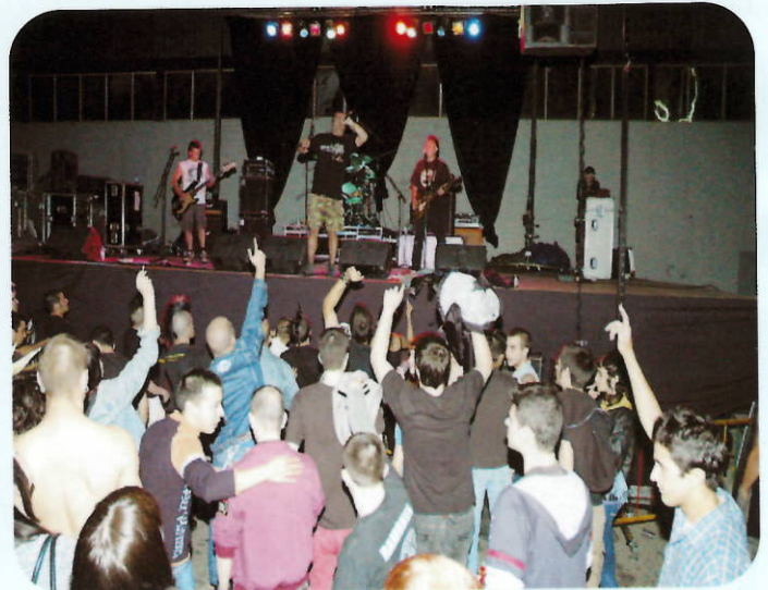
Los y las jóvenes disfrutaron una vez más del Badia'n' Rock