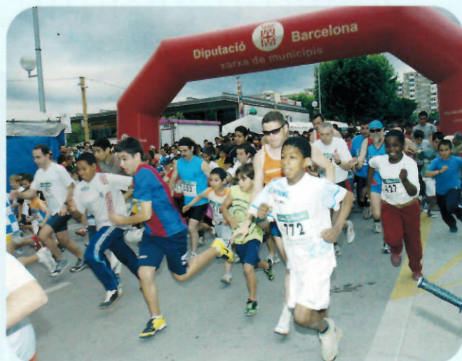
Èxit de participació a la 19ena cursa Popular