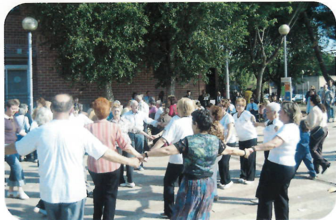
Bailada de sardanas en la plaza Mayor