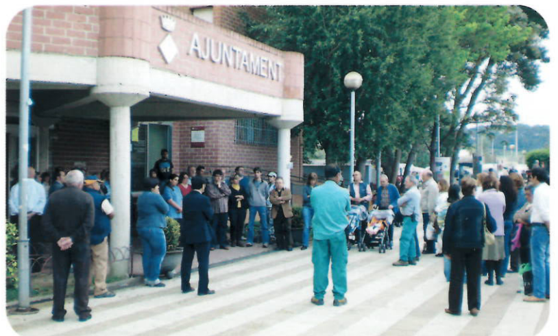
Muchos ciudadanos y ciudadanas se añadieron a la concentración

La convocatoria fue una propuesta unitaria de la Federación de Municipios de Cataluña y la Asociación Catalana de Municipios y Comarcas.