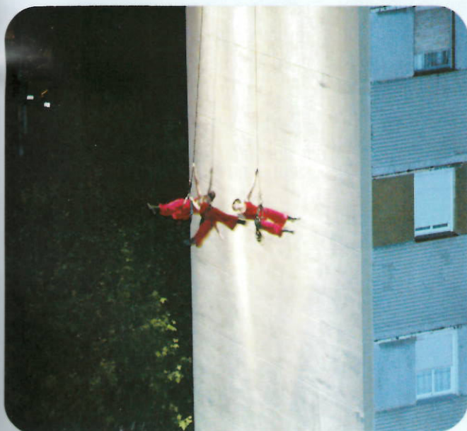
Deambulants sorprendió a los asistentes con sus danzas aéreas

Por otro lado BADÍA 2.0, un taller fotográfico impartido por miembros del Club de Fotografía de Badía, mostró, a través de la manipulación digital, la transformación de diferentes espacios de Badia del Vallès por tal que los ciudadanos del municipio pudieran crear imágenes imaginadas de nuestra, que reflejan sus aspiraciones, deseos y visiones de futuro. Con todas estas iniciativas, "PLASMA, ópticas culturales urbanas", aportó una nueva visión del arte a la Fiesta Mayor y a nuestra ciudad.