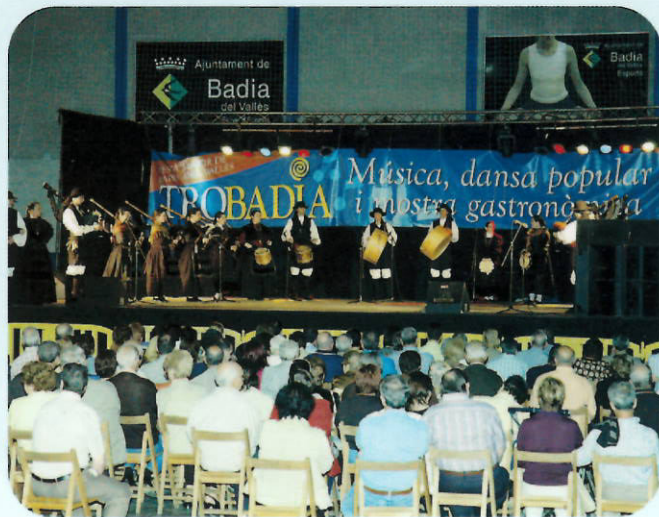
Un any més el Trobadia va omplir les instal·lacions esportives