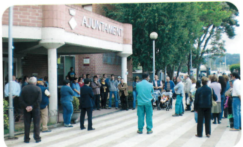
Molts ciutadans i ciutadanes es van afegir a la concentració

La convocatòria va ser una proposta unitària de la Federació de Municipis de Catalunya i l'Associació Catalana de Municipis i Comarques.