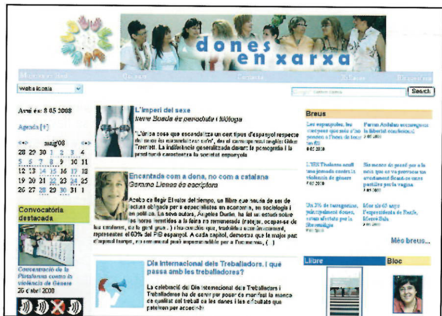
Vista de la página web www.donesenxarxa.cat

otros movimientos sociales, y que Internet sea para ellas una herramienta de comunicación, ciudadanía y visibilización. Y fomentar la participación de las mujeres jóvenes ya conectadas en espacios de mujer dentro de la red.