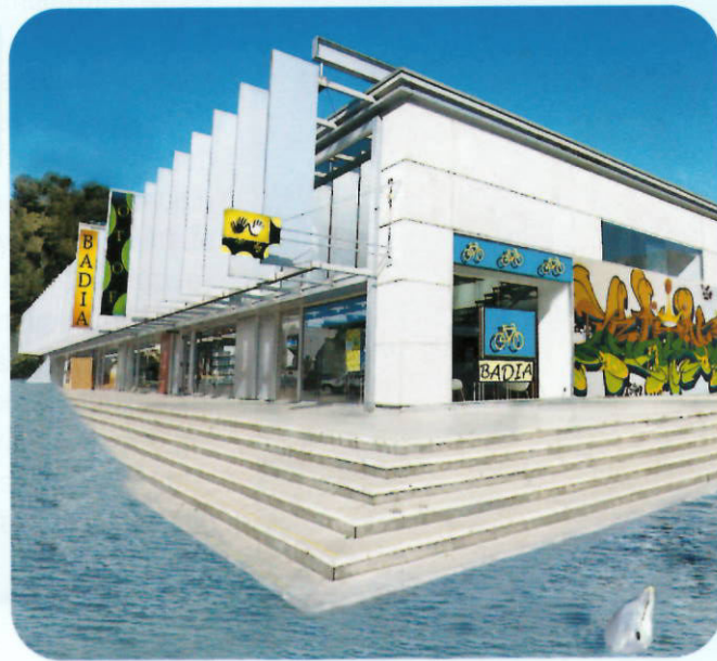
Una de les imatges del projecte Badia 2.0