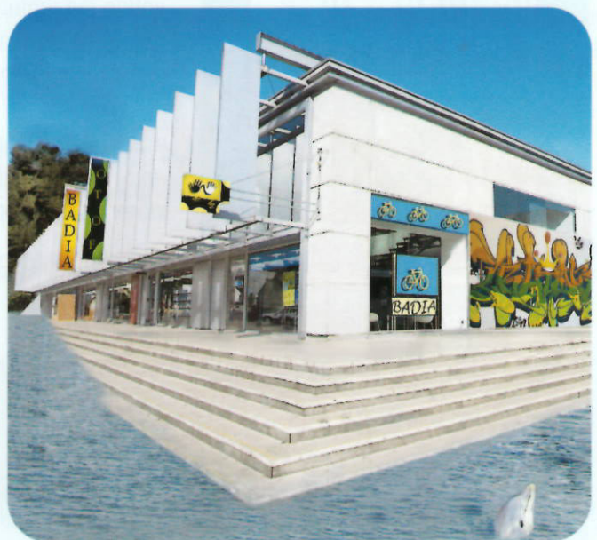
Una de las imágenes del proyecto Badia 2.0