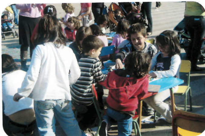
Activitats per al més menuts

La diada també es va aprofitar per fer el lliurament de premis dels diferents certàmens literaris que s'han realitzat a Badia del Vallès. Així doncs, l'Auditori Municipal va acollir l'entrega de guardons del Concurs Literari Escolar, del Concurs de Portada de Llibre i del XI Certamen Poètic de Badia del Vallès. Posteriorment a més es va realitzar un recital poètic en homenatge al poeta Miguel Hernández a l'Auditori Municipal. Finalment els actes de Sant Jordi van cloure el dia 30 amb una activitat dissenyada per a la família: "Marramiiii-aaaaoooo!!! narració amb objectes" a la biblioteca Vicente Aleixandre.