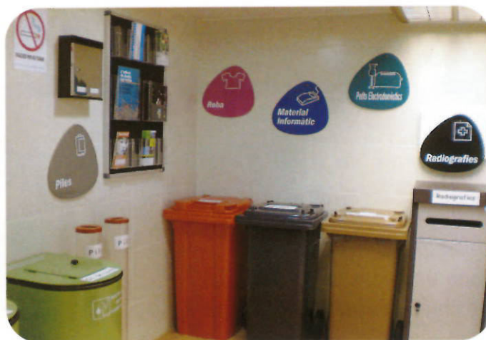
Interior de les instal·lacions de la nova minideixalleria

El passat 27 de març es va inaugurar la nova Minideixalleria ubicada al Mercat Municipal de Badia del Vallès. Fins ara, la Minideixalleria municipal ha estat situada en una de les parades del Mercat Municipal, ocupant una superfície de 5,25 m 2 . El funcionament d'aquesta és valorat molt positivament però la seva capacitat era reduïda, i per aquest motiu, s'ha millorat la seva gestió mitjançant l'ampliació d'aquesta instal·lació, ocupant dues parades del Mercat Municipal (10,5 m 2 ) i dotant-la de tots els elements necessaris per oferir un bon servei de recollida selectiva de residus per a la seva recuperació. Aquesta ampliació ha suposat l'execució d'una obra d'adequació de dues parades del mercat, l'adquisició de bujols i