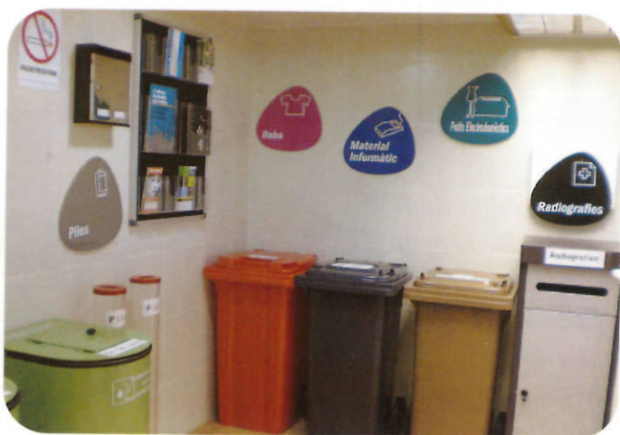
Interior de las instalaciones de la nueva "Minideixalleria"

El pasado 27 de marzo se inauguró la nueva Minideixalleria ubicada en el Mercado Municipal de Badía del Vallès. Hasta ahora, la Minideixalleria municipal estaba situada en una de las paradas del Mercado Municipal, ocupando una superficie de 5,25 m 2 . El funcionamiento de ésta se valora muy positivamente pero su capacidad era reducida, y por este motivo, se ha mejorado su gestión mediante la ampliación de esta instalación, ocupando dos paradas del Mercado Municipal (10,5 m 2 ) y dotándola de todos los elementos necesarios para ofrecer un buen servicio de recogida selectiva de residuos para su recuperación. Esta ampliación ha supuesto la ejecución de una obra de adecuación de dos paradas del mercado, la