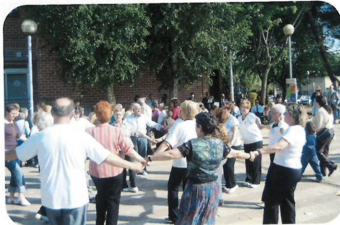
Ballada de sardanes a la plaça major