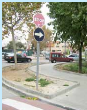
Arranjament de parterres i voreres

L'obra civil està pràcticament acabada, només restarà la recuperació de les zones verdes i la senyalització horitzontal (pintat). Pel que fa a les obres a les parades de bus (fase 3), la parada de Costa Brava està pràcticament finalitzada i s'iniciaran en breu les obres a la parada de l'avinguda Mediterrània.