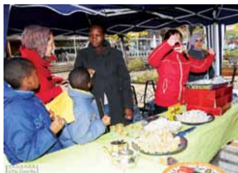
Parada de broquetes, pastes i te durant la Festa del Xai