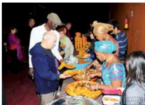
Sopar solidari, a càrrec de Diannah-ba-Catalunya i Asociación de Apoyo al Inmigrante de Badia (AAIB)

La jornada del dissabte va estar menys concorreguda a causa de la pluja i el fred. Tot i el mal temps, es va celebrar la tradicional Festa del Xai , on es van repartir broquetes de xai, te i pastes per a tothom. ■