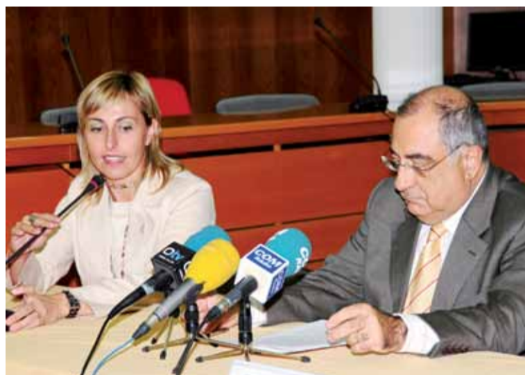
L'alcaldesa Eva Menor i el conseller Joaquim Nadal durant la roda de premsa celebrada a l'Ajuntament