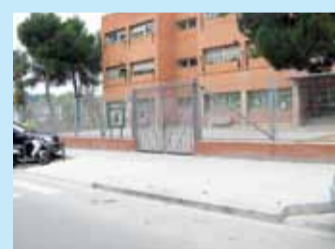
Supressió de barreres arquitectòniques davant de les escoles (zona Bètica)