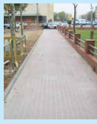
Taques i Parterres del Carre Algarve i Via de la Plata