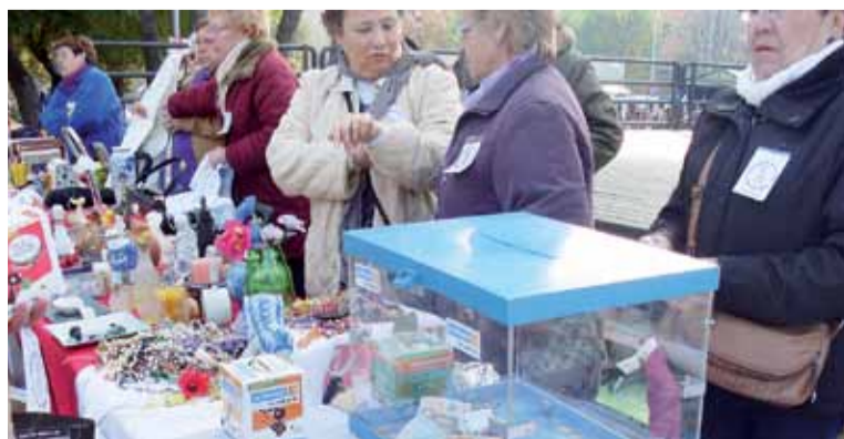
Voluntàries de l'Associació de Vidus i Vídues

malalties que, ara per ara, no tenen curació definitiva. A més, de la recaptació de fons, la Marató també té una tasca important de sensibilització de la població catalana respecte malalties a les quals es dedica i a la necessitat de potenciar la recerca científica per prevenir-les. ■