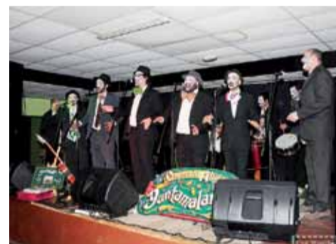
Orquesta Atípica Yuntamalandra