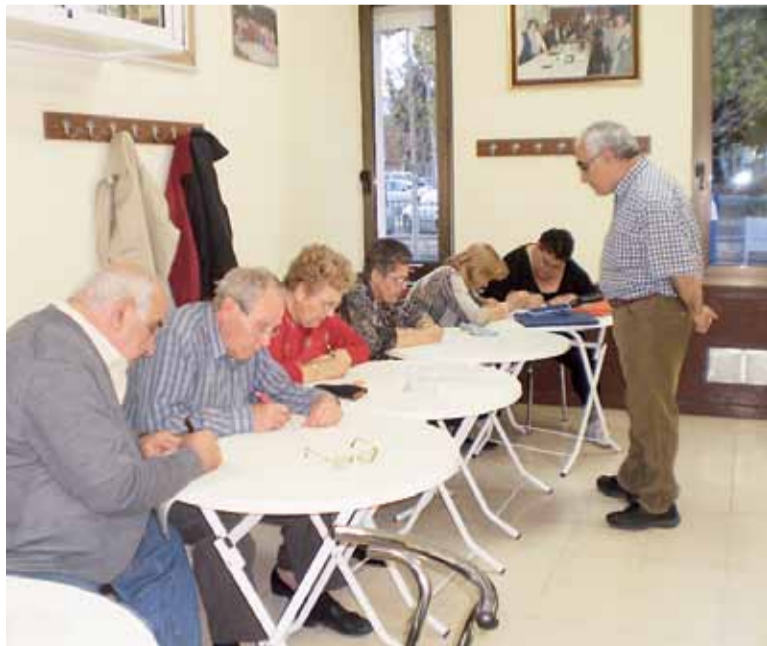
Peu de foto

También el día 25 de Noviembre montamos en la plaza mayor de Badia, con la ayuda del Ayuntamiento, unas paradas solidarias en las que vendimos pulseras, figuras, peluches, pasteles etc. con intención de recaudar fondos para la maratón de tv3, esperando la solidaridad de las personas de Badia aunque sabemos que no estamos en momentos económicos muy sobrados pero con un poco de voluntad podemos ayudar para la investigación de este año que está dirigida a las lesiones medulares adquiridas.